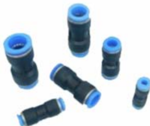
Union Conectora para Poliamida (Tubo - Tubo) Modelo PU