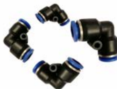
Union Conectora para Poliamida (Angulo 90°) Modelo PV