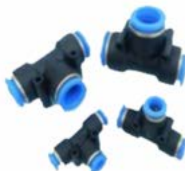
Union Conectora para Poliamida (TEE - Tubo - Tubo) Modelo PE